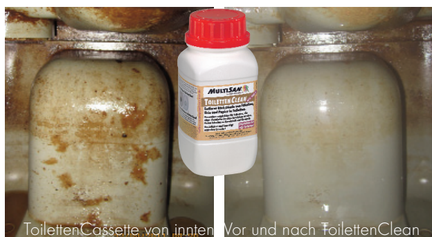
ToilettenCassette von innen Vor und nach ToilettenClean

Die Toilette ist in ihrer „Unterwelt“ meist in einem schlimmen Zustand!