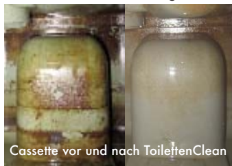
Cassette vor und nach ToilettenClean

Multiman ToilettenClean ist ein Toilettenreiniger der Extraklasse. Er beseitigt fäkale Ablagerungen, schlechten Geruch, Urinstein, Kalk und Papierreste in kurzer Zeit.